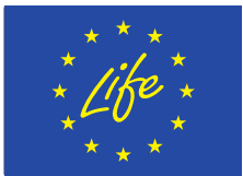
График за кандидатстване по покана LIFE 2020